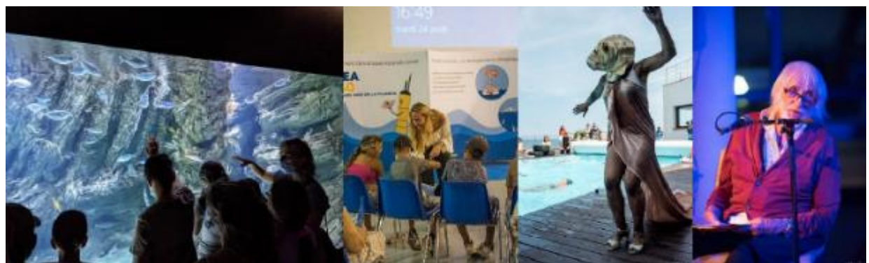
Souvenirs de 2021